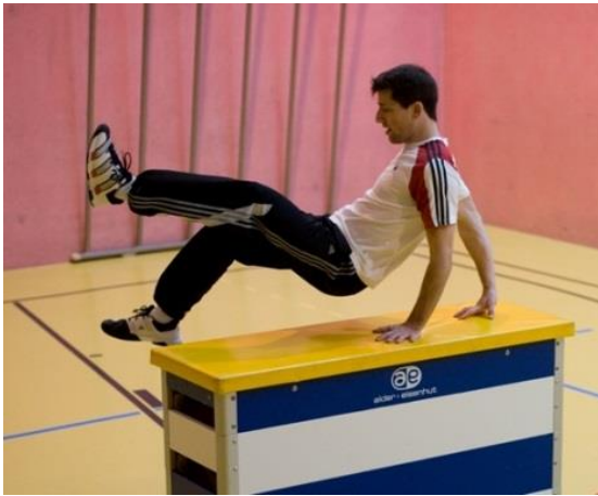
Lazy (saut ciseaux)