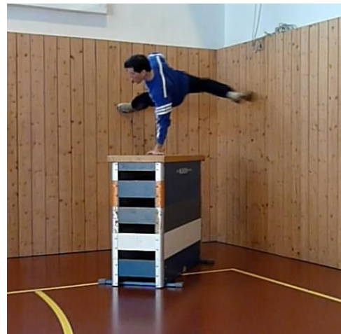
Edge Run (course entre 2 murs à 90°)