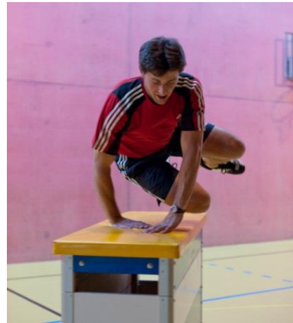
Reverse (franchissement avec saut 360°)