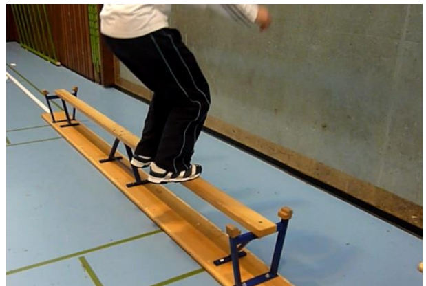
Saut de précision (sur une petite cible / bord d'obstacle)