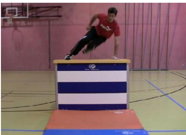
Passement (une main et un pied sur l'obstacle)