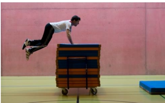
Saut de chat (plongeon avec jambes → entre les bras)