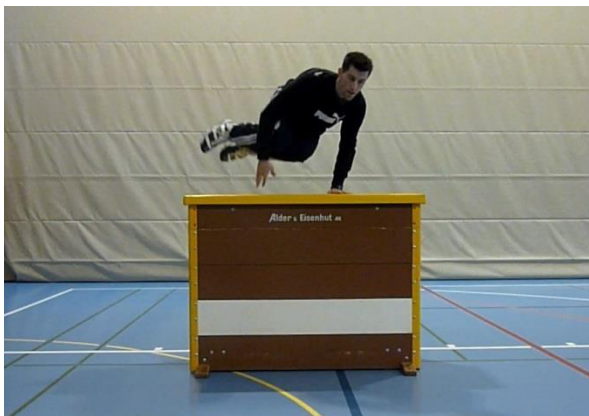
Saut costal (jambes à côté des 2 mains)