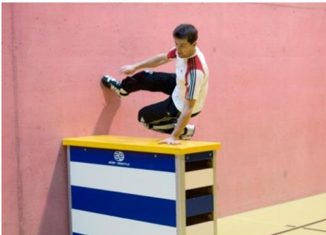
Tic Tac (appui contre un mur)