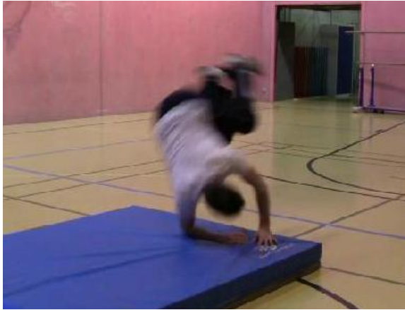
Chute (roulade depuis l'épaule)