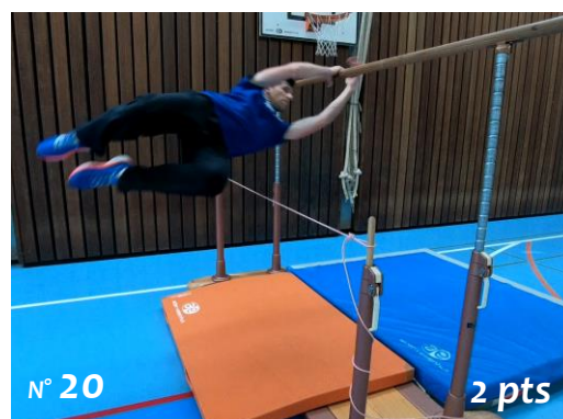
Challenge aux barres par-dessus un élastique (= b.b.) tendu à 1 m.