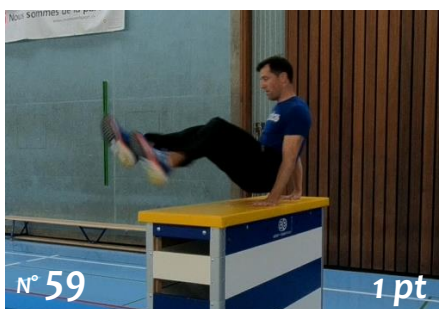
Lazy (passage dorsal)

Les mouvements des évaluations cantonales de 11H