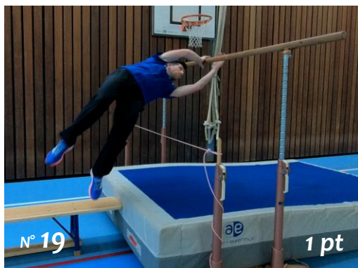
Saut à travers les barres depuis un banc