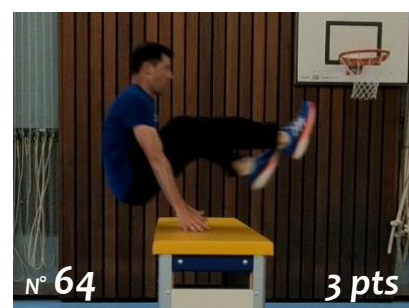
Saut du voleur